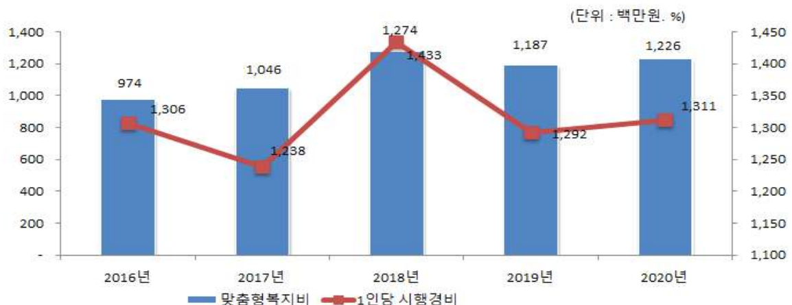
맞춤형복지제도 시행경비 연도별 추이