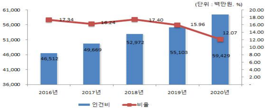
인건비 연도별 변화

☞ 세출 결산액이 전년 대비 약 43% 증가하여 인건비가 전년 대비 약 8% 증가했음에도 인건비 비율이 전년대비 약 3.9% 감소했습니다.