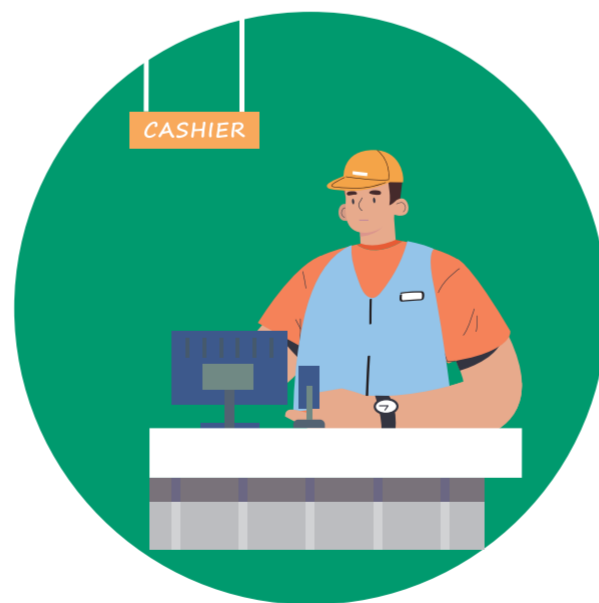
고령의 할머니를 대신해 생계유지를 위한 아르바이트를 하는 바다