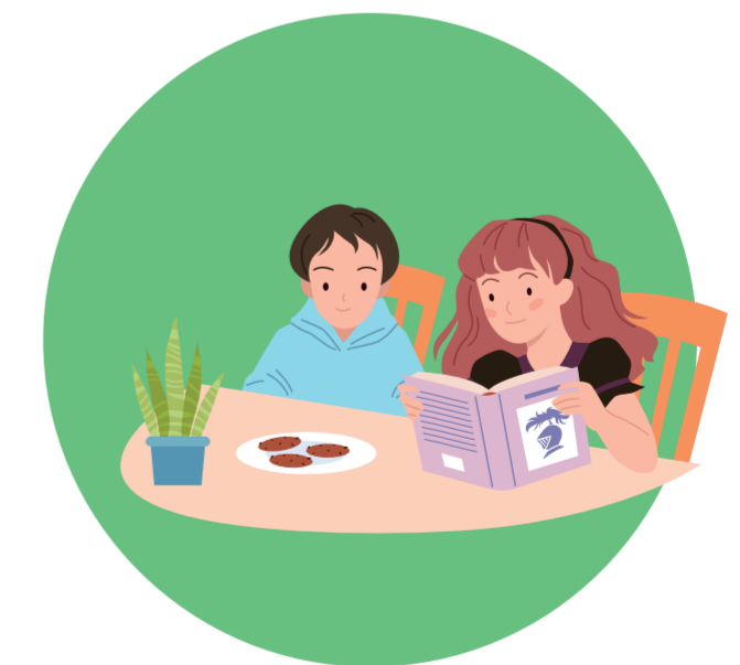
시각장애가 있는 동생에게 책을 읽어주고 산책을 돕는 하늘이