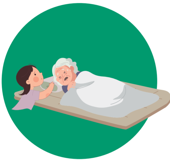
아픈 할머니를 간병하는 봄이