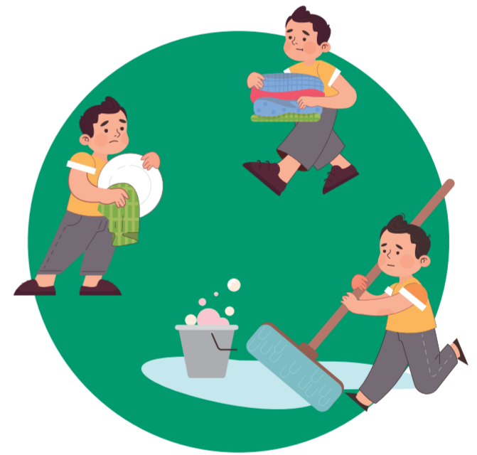
우울증으로 바깥출입이 어려운 엄마를 대신해 집안일을 하는 가을이