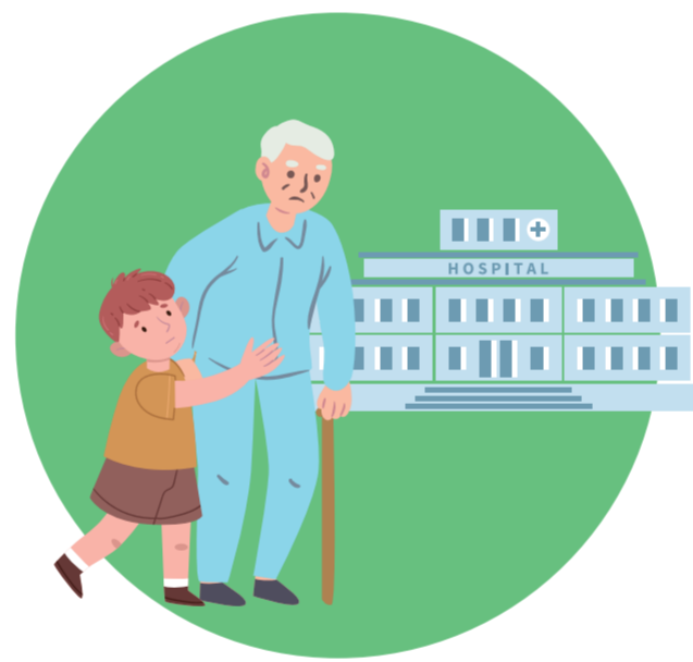
거동이 힘든 할아버지를 모시고 병원을 가는 여름이