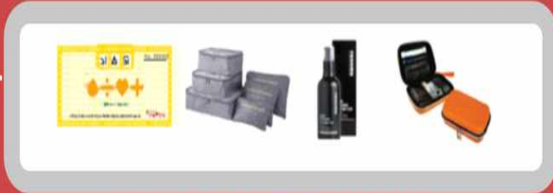
기부권/여행용파우치/ 中 1 레노마올인원/휴대용구급함

※ 천마라이온스에서 채혈후 헌혈 불가판정시 에도 감사의 마음을 담아 라면(5개입) (선착순100명)을 드립니다