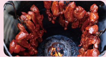
혐기적 조건상의 육류의 대량 조리