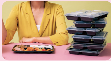
도시락 등 대량조리 식품의 상온보관