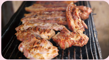
돼지고기 등 육류의 불충분한 가열